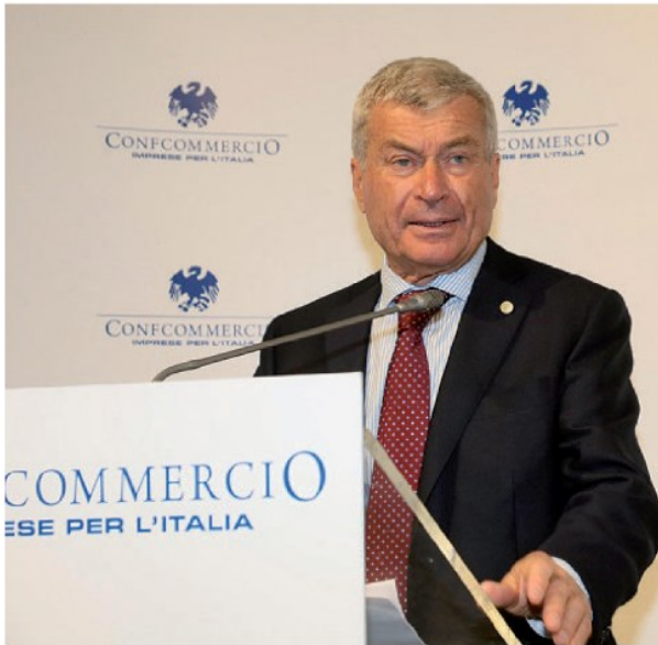
Carlo Sangalli, detto Carluccio, 83 anni, presidente di Confcommercio e di Unioncamere.